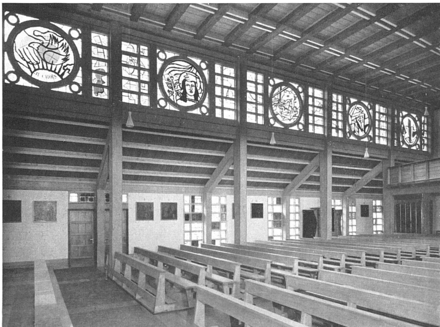
Blick zum rechten Seitenschiff / Bas-côté droit / View of the right aisle

bildet und den Innenraum hell und luftig macht. Zuerst wurden die 8,25 m hohen vorgefertigten Hauptpfeiler als Stützen für das Dachgebälk aufgerichtet. Die am Platz gegossenen Versteifungsbänder und die Tragkonstruktion der Seitenschiffe verstreben sie. Der Beton wurde gestockt. Für die Holzdecke des Mittelschiffs wurden die alten Balken freigelegt.