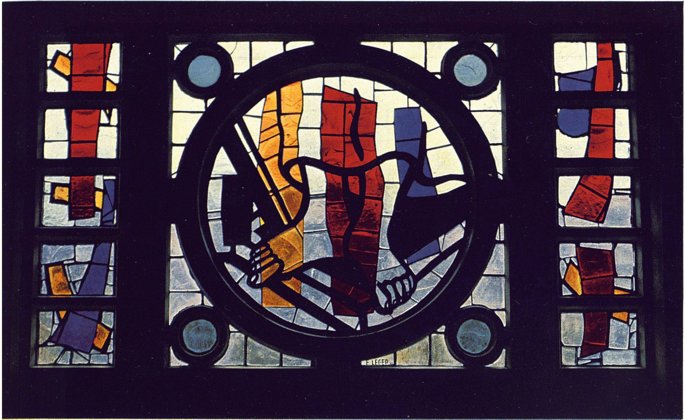
Fernand Léger, Die Auferstehung. Glasgemälde im Mittelschiff | La Résurrection; vitrail de la nef | The Resurrection. Stained glass in the middle aisle

Es ist ein besonderes Verdienst der Architektin und der Kirchgemeinde, daß es gelang, für die Glasfenster den französischen Maler Fernand Léger zu gewinnen. Wie in Audincourt sind die farbigen Gläser mit Zement vergossen und in Betonrahmen eingespannt. Die Fensterfläche mißt 100 m 2 . Dargestellt sind im Chor die Hochzeit von Kana und die Vermehrung der Brote, in den zehn Medaillons des Hoch-