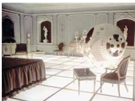
22 «Space Odyssey» (n4)