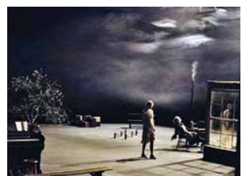
03 «Dogville» (a16)