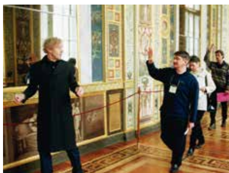
20 «The Russian Ark» (m2)