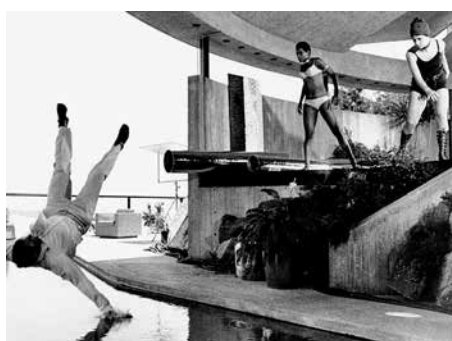
11 «Diamonds are forever» (l3)