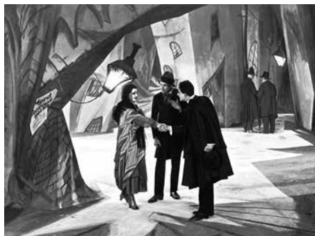
14 «Das Cabinet des Dr. Caligari» (g1)