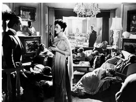
04 «Exterminating Angel» (c2)