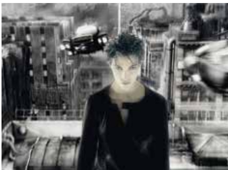
25 «Immortel ad Vitam» (n16)

3 Wo nicht anders vermerkt, stammen die Bilder von Keystone