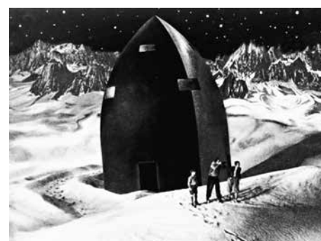
06 «Frau im Mond» (n2)