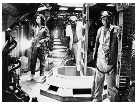
23 «Alien» (n8)