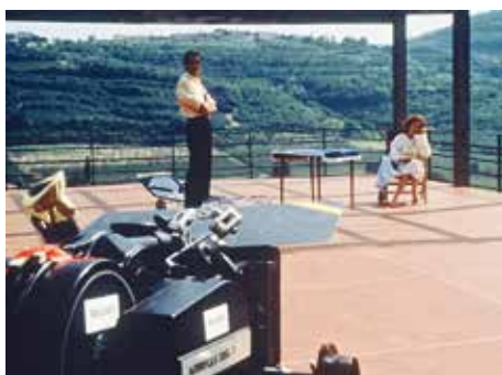
19 «Il Girasole» (k9)