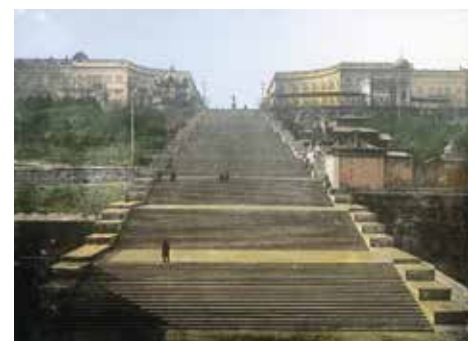
12 «Brazil»: Potemkinsche Treppe Odessa (e6)