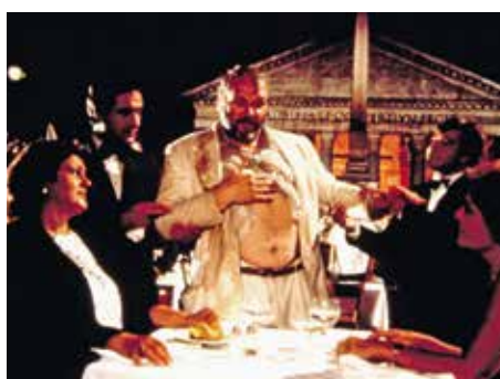
02 «The Belly of an Architect» (a11)