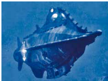
26 «20 000 Leagues under the Sea» (p1)