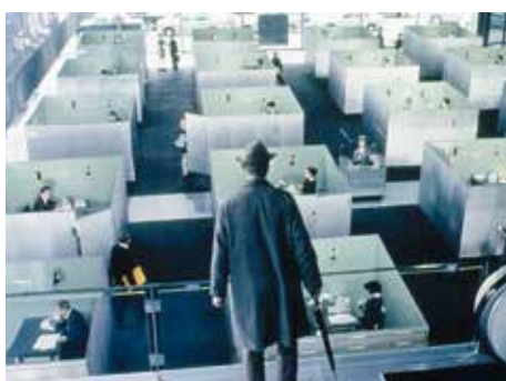
01 «Tati's herrliche Zeiten – Playtime» (a6)