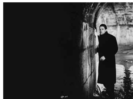
18 «Der dritte Mann» (k1)