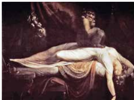
17 «The Gothic» – Füsslis «Nachtmah» (j7)