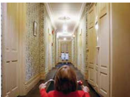
10 «The Shining» (d6)