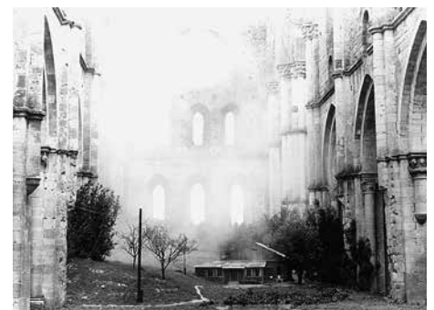
15 «Nostalghia» (b2)