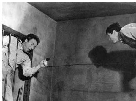
16 «Escape from Alcatraz» (g6)