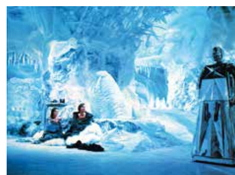
24 «Logan's Run» (n7)