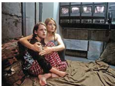
08 «Panic Room» (c7)