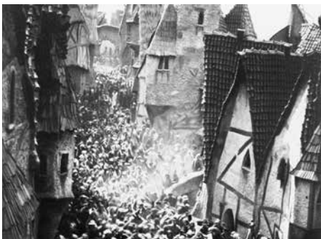
13 «Der Golem, wie er in die Welt kam» (f1)