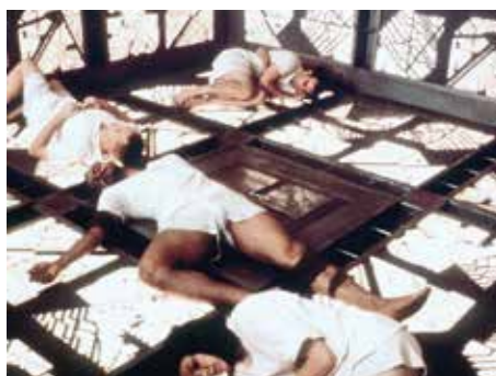
05 «Cube» (c5)