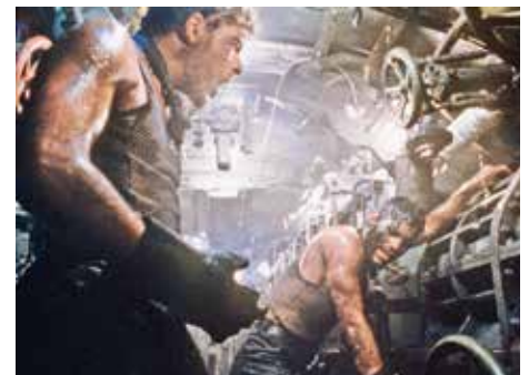
27 «Das Boot» (p2)