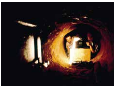
07 «Being John Malkovich» (c6)