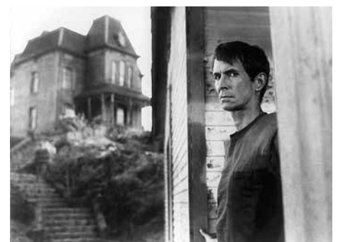
09 «Psycho» (d1)