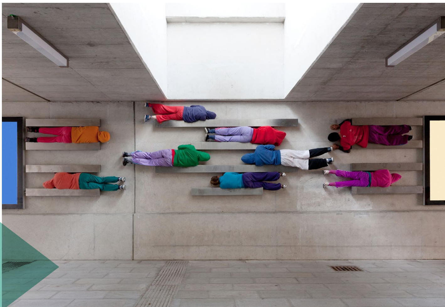
© Willi Dörner: bodies in urban spaces.

espazium.ch neue Zielgruppen. Statistiken zeigen, dass lokale und regionale Inhalte, von der Agenda über News bis zu den Wettbewerben, regional besonders beliebt sind. Die meisten Klicks erhielten das elektronische Dossier über funktionalen Holzbau, ein Beitrag zur Erneuerung des Museums Unterlinden in Colmar, ein Bericht über einen Brückenneubau sowie ein Artikel über die architektonische Ausgestaltung des AlpTransits: