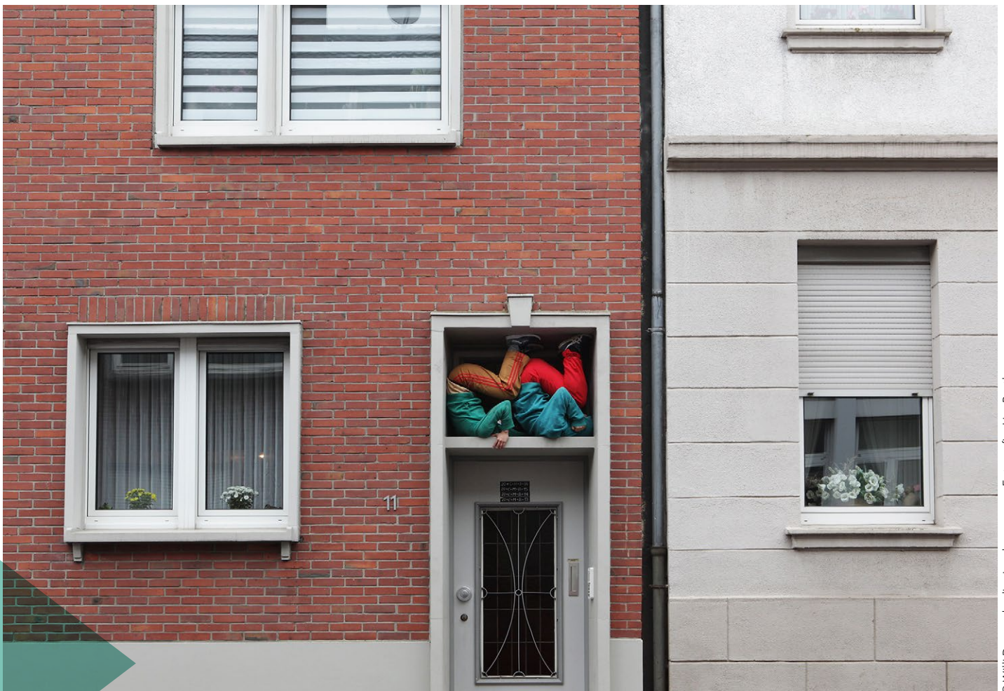
© Willi Dörner: bodies in urban spaces.

Den Austausch mit dem SIA haben wir intensiviert und systematisiert. Regelmässige Treffen auf den Ebenen Präsidium und Geschäftsleitung sowie projektbezogen ermöglichen uns, das Potenzial an Synergien und Kooperationen besser