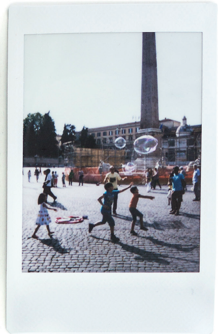
Verfall, Kunst und Lebensfreude: Roma aeterna – Momentaufnahmen der Ewigen Stadt.