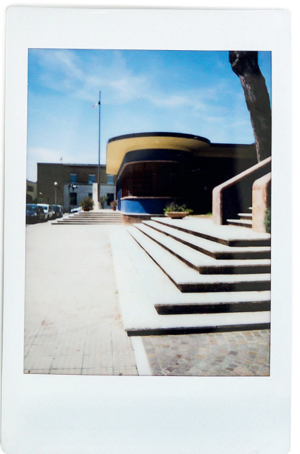
Eindrücke der Kreuzfahrtteilnehmerinnen und -teilnehmer aus der sozialistischen Stadterweiterung Split III (Reihe 1 und Reihe 2 Bild links; vgl. TEC21 24/2014) und aus Sabaudia, der faschistischen Stadtneugründung in den pontinischen Sümpfen.