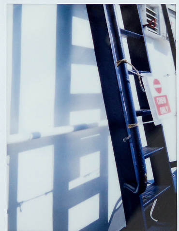
Dokumentation mit präzise definierten Parametern: Schiffsdetails in Weiss und Rot von Reiseteilnehmer, Geometrie-Ingenieur und Entdecker des Lisaeders Urs B. Roth (untere Reihe links; vgl. TEC21 7/2010).