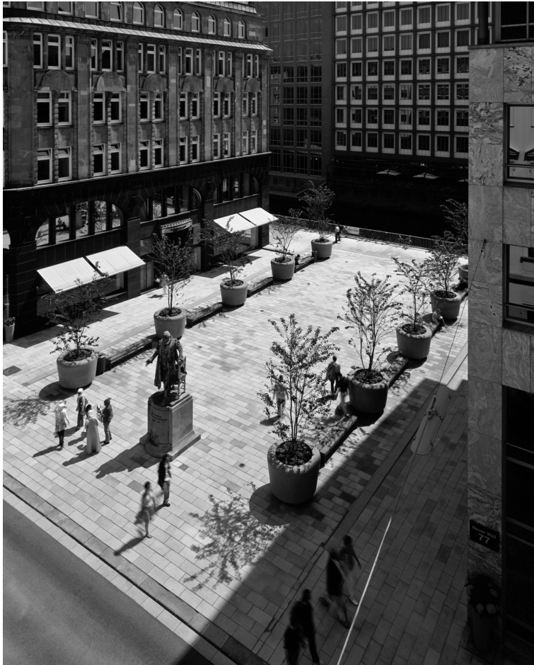
Hamburg: Neuer Wall in neuem Glanz

Trotz zahlreicher erfolgreicher Beispiele im Ausland wurde der Ansatz der „Business Improvement Districts“ in der Schweiz bislang nicht umgesetzt. Dazu müsste im kantonalen Bau- und Planungsrecht eine entsprechende gesetzliche Grundlage geschaffen werden, die auf kommunaler Ebene umgesetzt werden könnte. Ein viel wesentlicheres Umsetzungshindernis als die Notwendigkeit einer Gesetzesrevision stellt die Verpflichtung einer Minderheit von Grundeigentümern