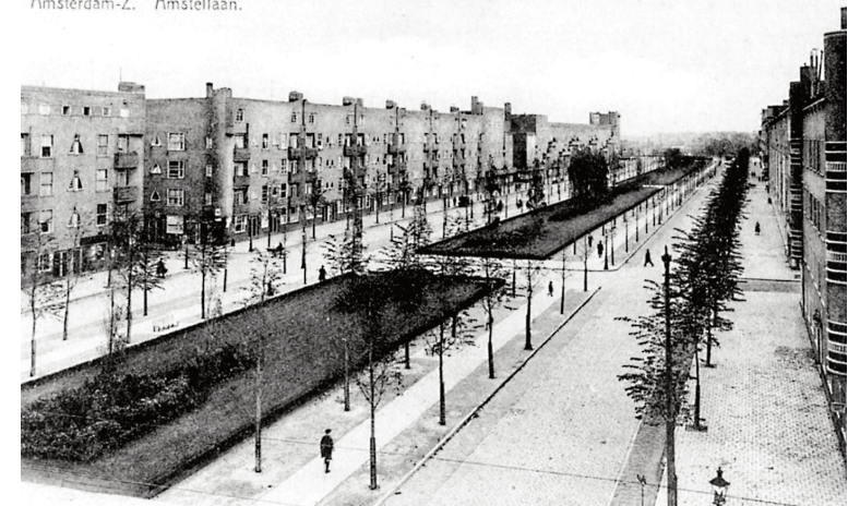
Stadtbaukunst: Schöne Stadtquartiere entstehen durch das Ringen um die Schönheit des Stadtquartiers – hier mit Hilfe einer Schönheitskommission.

Noch in anderer Hinsicht lehrt die Städtebaugeschichte, wie städtische Schönheit erreicht werden kann. Da ist die unglaublich lange und reiche Geschichte von städtischen Gestaltungsmaßnahmen, die vom Mittelalter bis heute mit Baugesetzen, Gestaltungssatzungen, Musterbauten oder Schönheitskommissionen des sich stets der Einzelentscheidung entziehenden Gesamtgesichts der Stadt Herr zu werden versuchte und auf diese Weise die gelungensten und allgemein als schönste anerkannten Straßen-, Platz- und Stadtanlagen schuf. Fast keines der von uns so geliebten historischen Stadtbilder ist zufällig oder aufgrund unbewusst wirkender Traditionen entstanden: Ob Siena, Turin, Paris oder Amsterdam-Süd – stets waren es strengste Maßnahmen, durch die erst das schöne Stadtbild entstand.