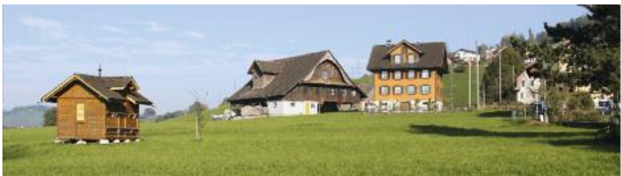
Liegenschaft untere Schürmatt

Kanton Schwyz und der Bezirk Küssnacht haben durch Vorverträge Priska Fassbind den Ersatz der Parzelle zugesichert. Der Kanton Schwyz wird auf dem Grundstück Fassbind die für den Bau und den Betrieb der Südumfahrung notwendigen Erschliessungsanlagen erstellen.