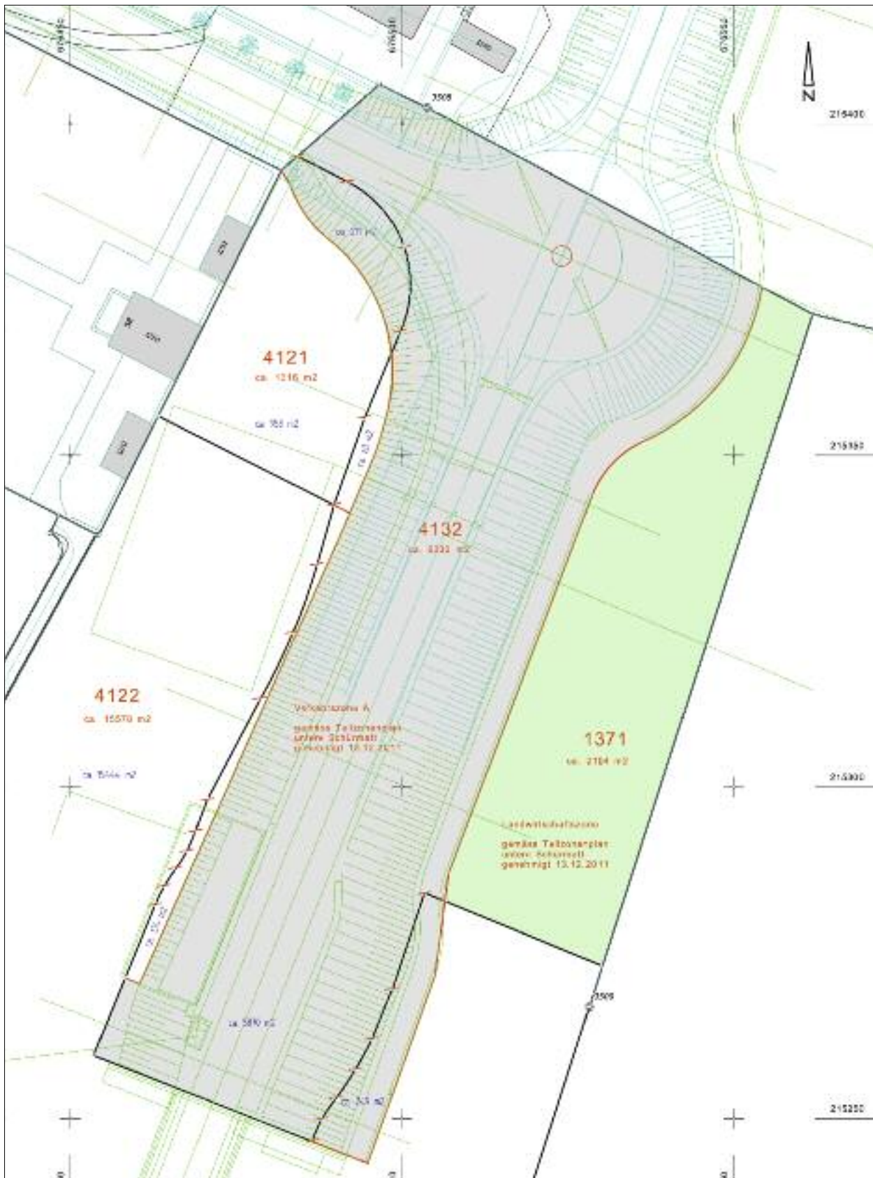
Situation Erwerb Land Kanton (4132 und 1371)

Der Vorvertrag zwischen dem Bezirk Küsnacht, als Eigentümer und dem Kanton Schwyz, als Erwerber der Grundstücke GS 4132 und GS 1371 liegt vor. Informativ sei erwähnt, dass der Kanton praktisch die gesamte Restfläche von ca. 17 000 m 2 , während der Bauzeit als Installations-, Lager- und Deponiefläche beansprucht. Dafür ist eine Entschädigung von Fr. –50/m 2 und Jahr geschuldet.